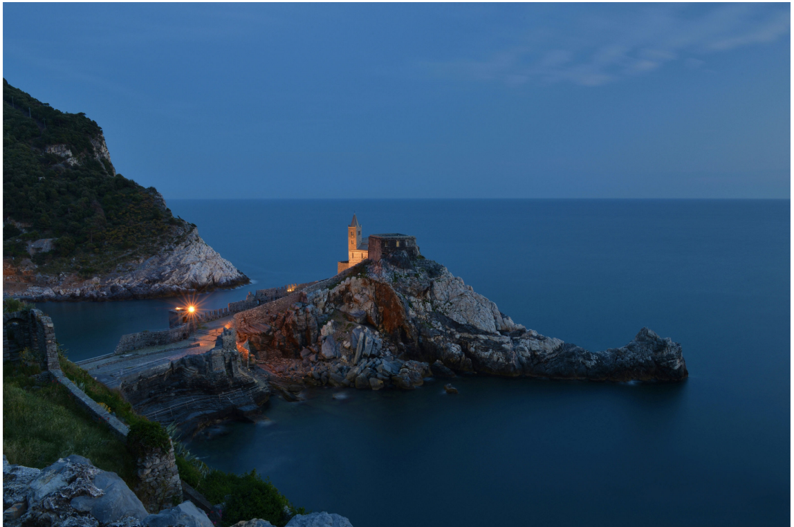
LUCE DELLA QUIETE, di Alessandra Piasecka