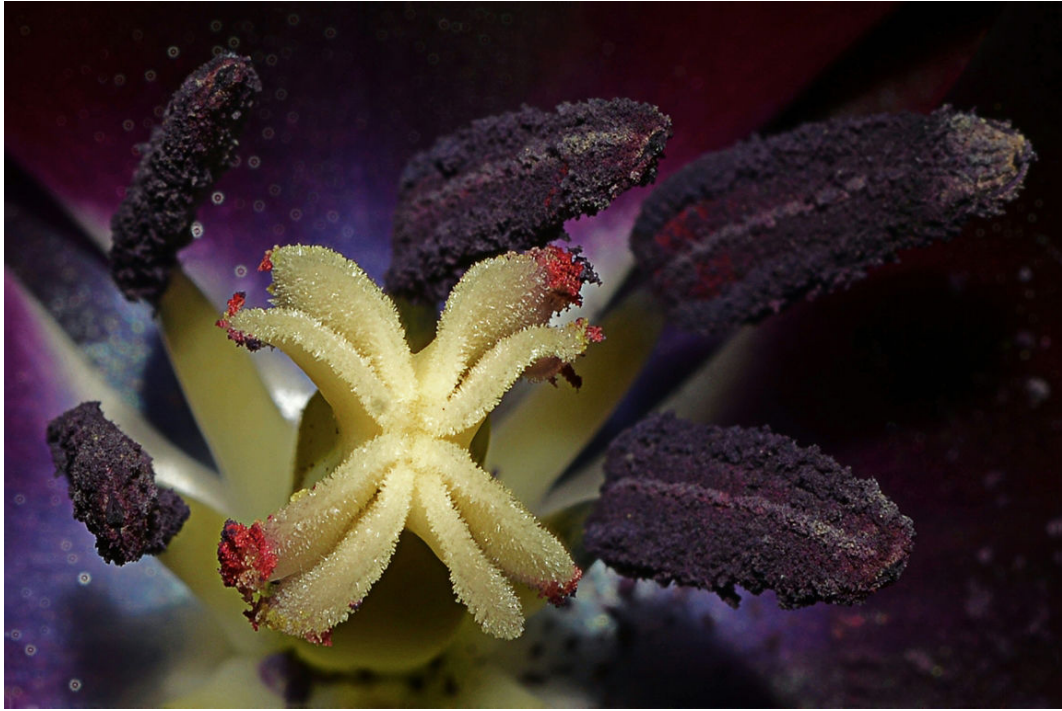
VENTRE DI UN TULIPANO, di Alessandra Piasecka