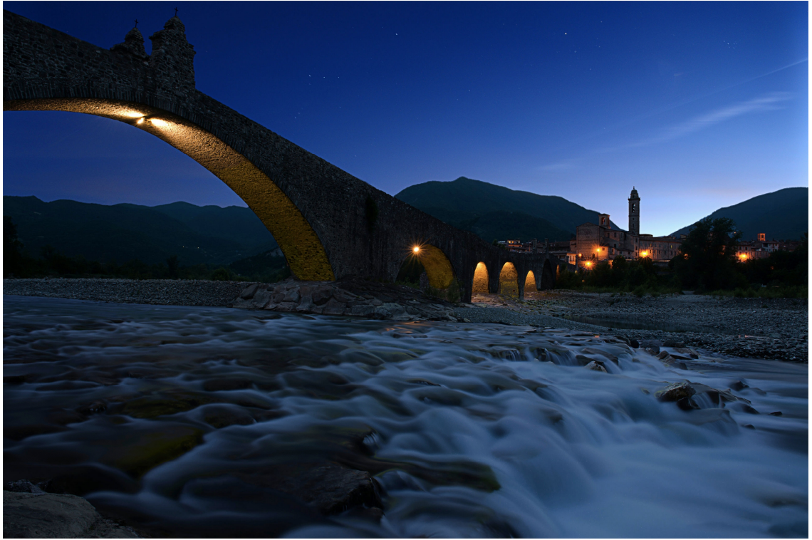
ORA STELLARE, di Alessandra Piasecka