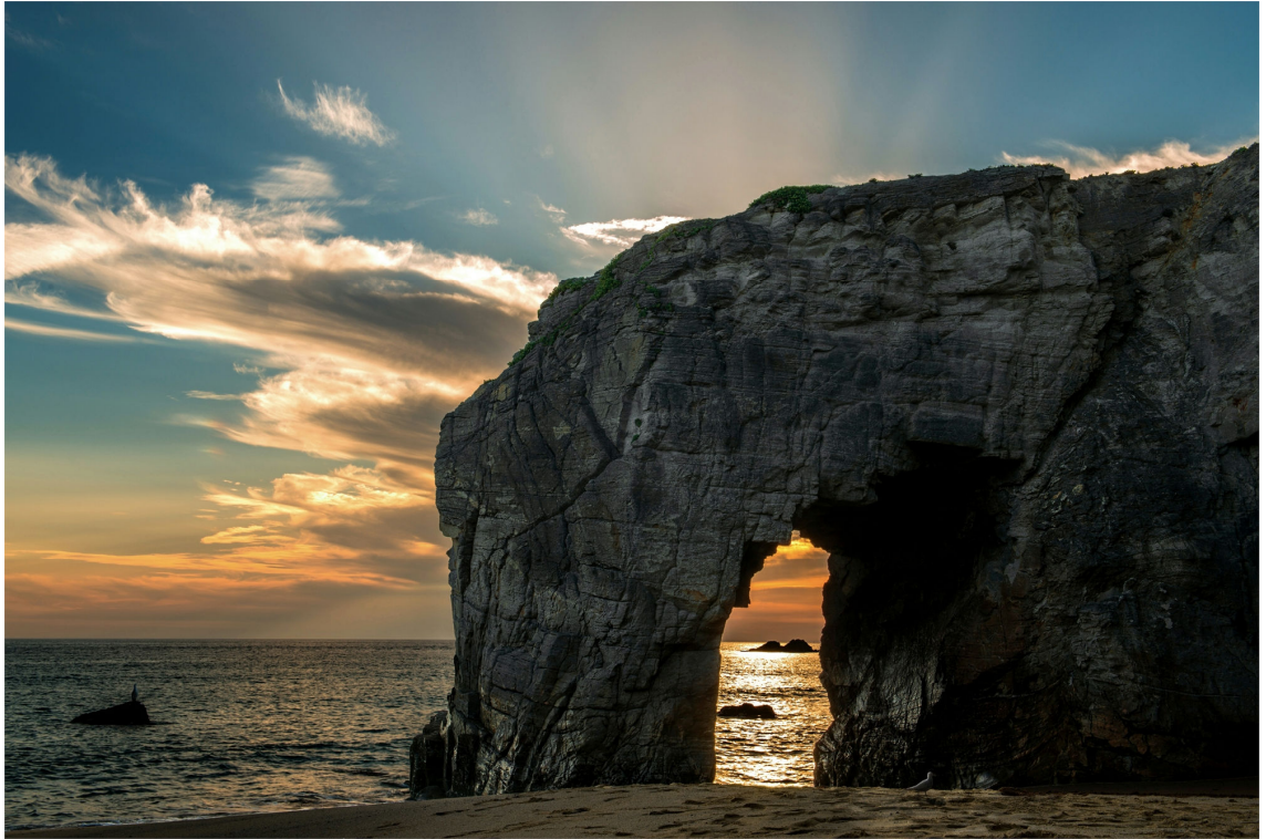
AL DI LÀ DELLA PORTA D'ORO, di Alessandra Piasecka