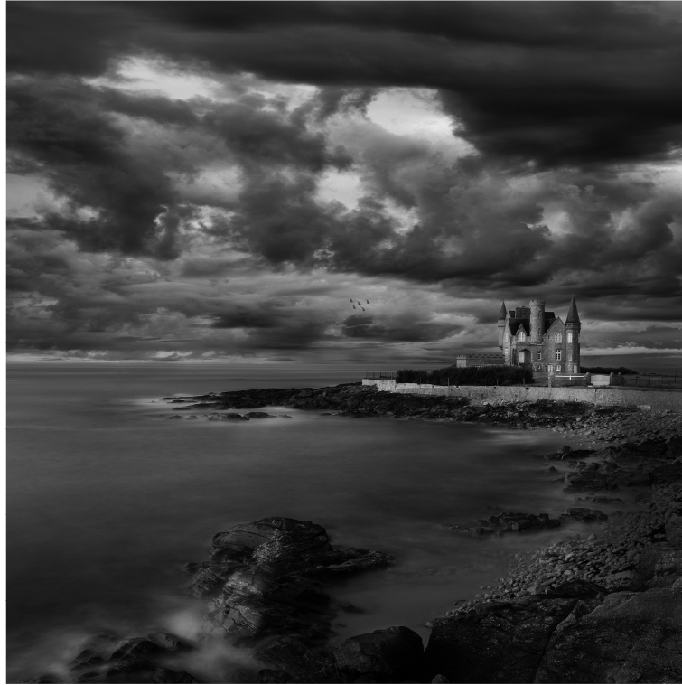
PRELUDIO, di Alessandra Piasecka