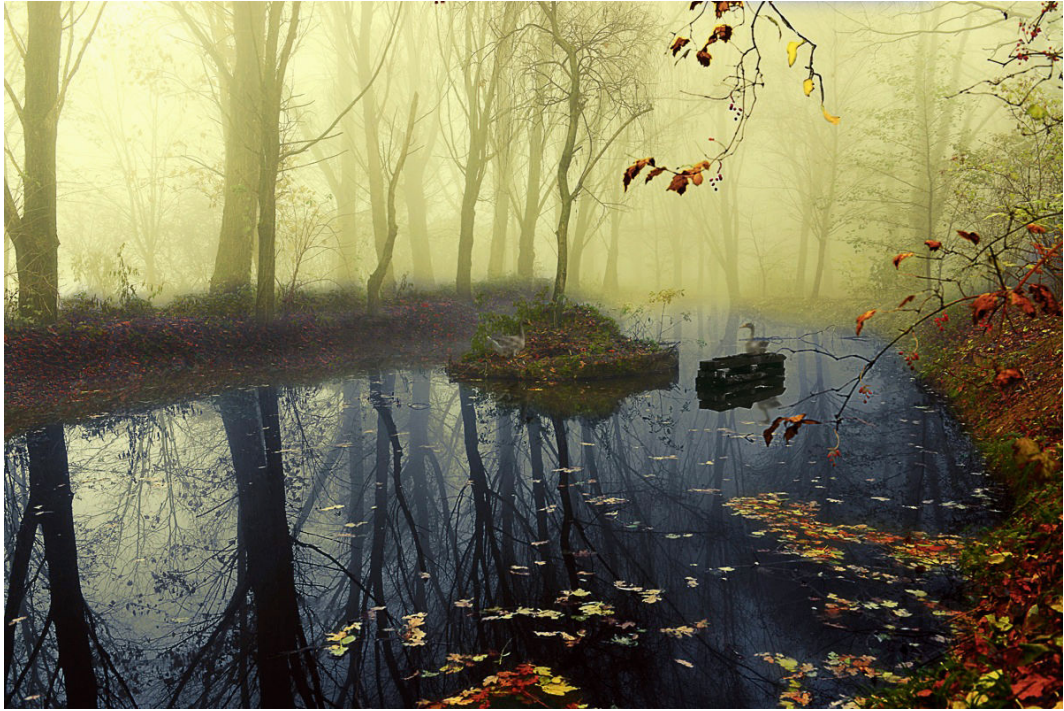
LA STAGIONE PERDUTA, di Alessandra Piasecka