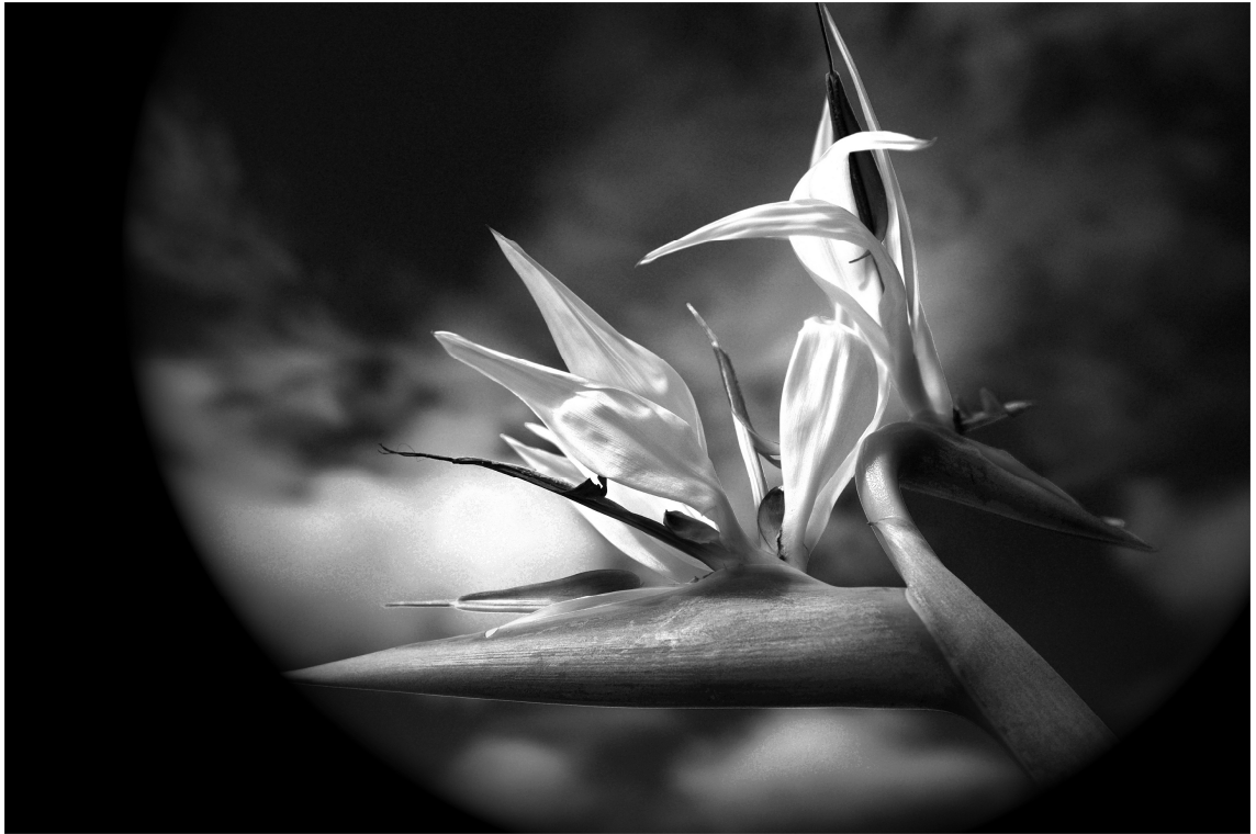
VERSO LA LUNA, di Alessandra Piasecka