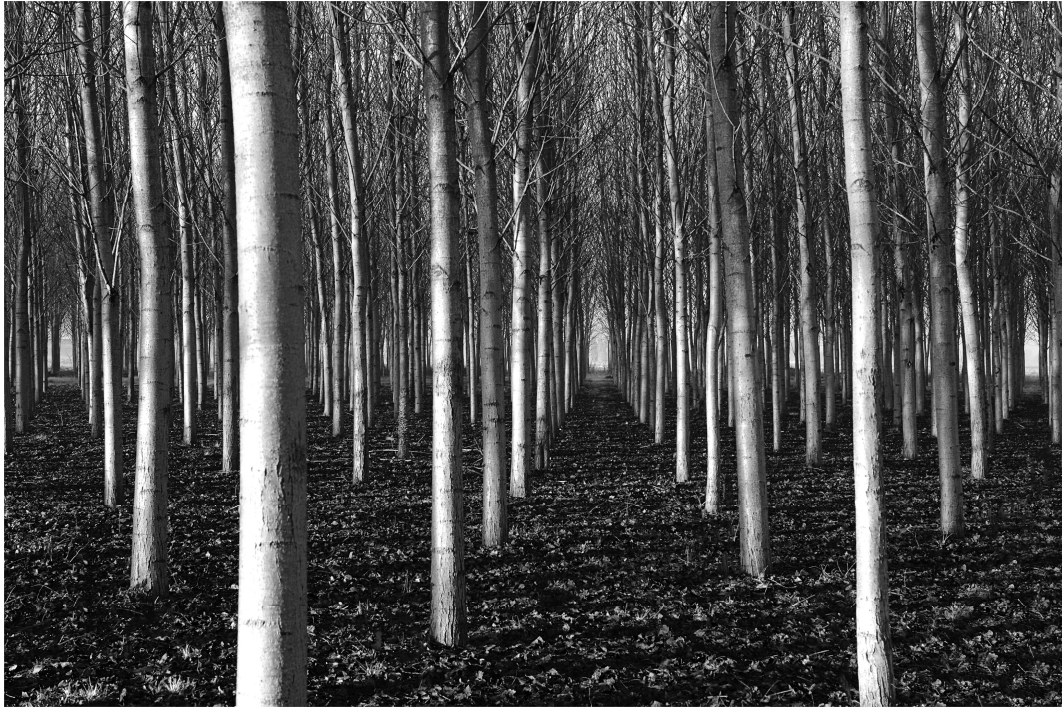
VIE DI FUGA, di Alessandra Piasecka